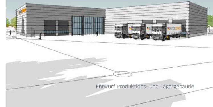
Entwurf Produktions- und Lagergebäude